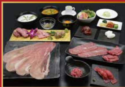
ブルズリッチコース ¥7,800コース(税込)