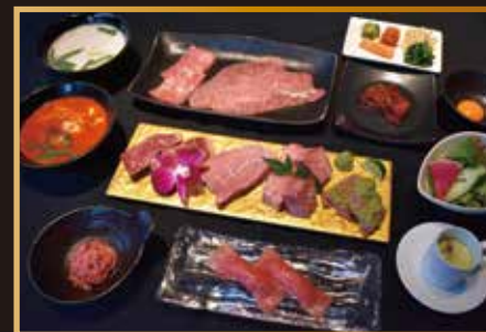
ブルズゴージャスコース ¥9,800コース(税込)