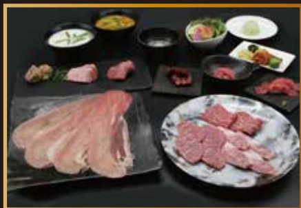
ブルズスタンダードコース ¥5,800コース(税込)