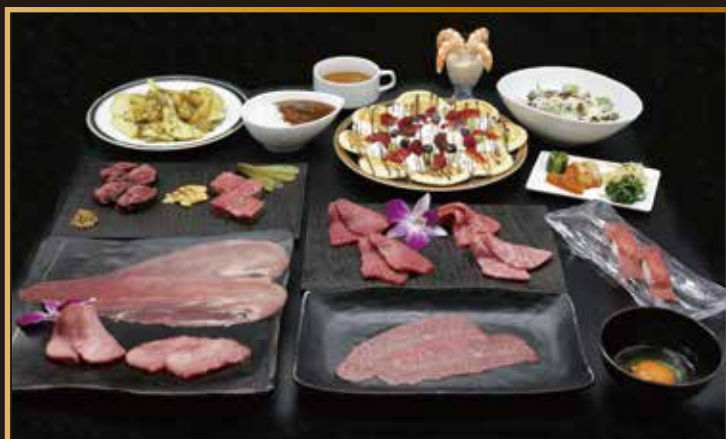
ディナーカラオケパーティープラン ¥6,800 (税込)