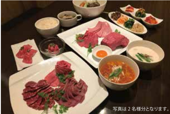
写真は2名様分となります。